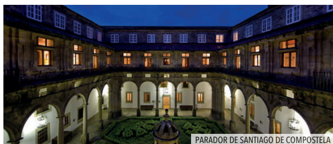
PARADOR DE SANTIAGO DE COMPOSTELA

Desayuno en el Parador. Salida hacia Toledo. La ciudad de las tres culturas. Cristianos, musulmanes y judíos. Una de las más interesantes y sorprendentes ciudades de España en la que es posible ver, en cuestión de pocos metros, una catedral gótica, una mezquita del siglo X y dos sinagogas. Continuación a Madrid, llegada fin del viaje y de nuestros servicios.