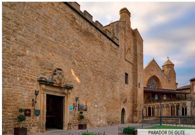
PARADOR DE OLITE

Desayuno en el parador y mañana libre en Avila para disfrutar de la ciudad y sus monumentos. Por la tarde continuación hacia Madrid. Llegada y fin del viaje del PLAN 1.