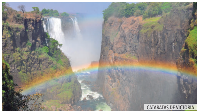
CATARATAS DE VICTORIA